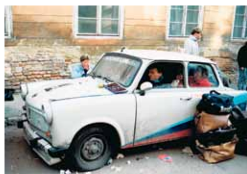
POSLEDNÍ CHVÍLE TRABANTU

Uprchlíci z NDR přebývají v blízkosti ambasády západního Německa; Praha 4. října 1989