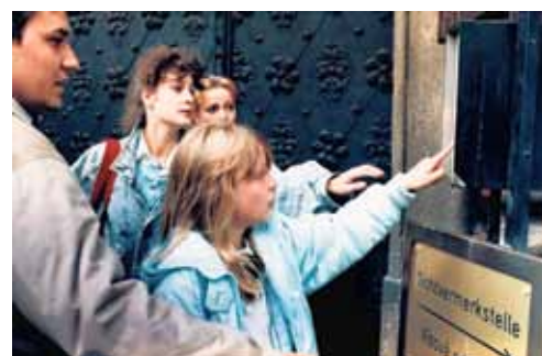
CHCEME K VÁM Uprchlíci z NDR se dožadují vstupu na ambasádu SRN, Praha 3. listopadu 1989