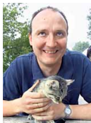
VYPRÁVĚČ Thomas Brussig a kočka

Rozhovor MF DNES s proslulým německým spisovatelem THOMASEM BRUSSIGEM o životě v NDR, o takzvané ostalgi a také o fotbale.