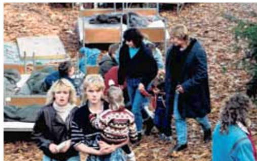
NA ZAHRADE AMBASÁDY SRN Ještě tam nebyly stany, uprchlíci spali bez přístřeší; Praha 20. září 1989