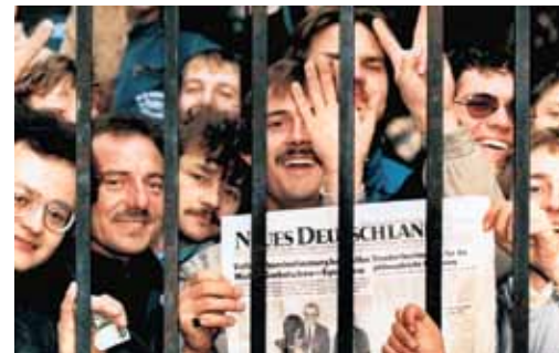
RADOST Uprchlíci za plotem ambasády SRN s výtiskem deníku Neues Deutschland; Praha 3. listopadu 1989