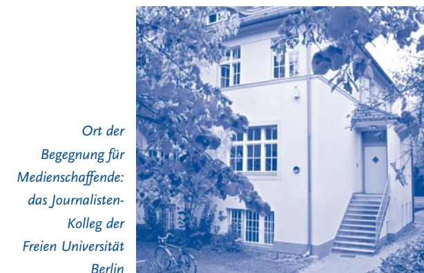
Ort der Begegnung für Medienschaffende: das Journalisten- Kolleg der Freien Universität Berlin