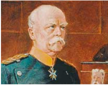
Reichskanzler Bismarck Deutsche Namens-Eiche