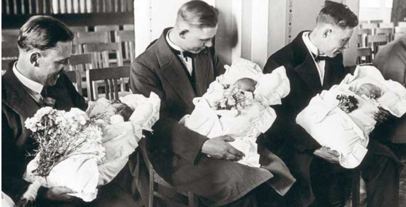
Väter vor einer Taufe in Berlin (1931): Religiöse Verpflichtungen gelockert