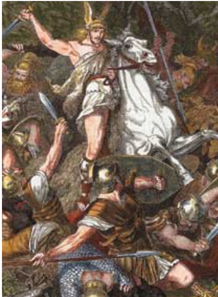
Nationalheld Hermann Chance für deutsche Namen

Keine Bestätigung durch die Vornamensvergabe findet die von Ulrich Beck und Elisabeth Beck-Gernsheim vertretene verschärfte These, wonach sich auch die sozialen Milieus auflösen. Eine „Entschichtung“ zwischen „Niedrigqualifizierten“, „Qualifizierten“ und „Hochqualifizierten“ findet nicht statt.