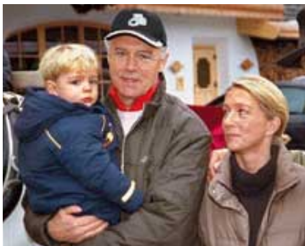
Vater Beckenbauer* Kaiserlicher Instinkt

Wie kann man das feststellen? Gerhards und sein Team zählten aus, wie oft Vornamen von Popstars und Fußballstars vergeben wurden – eher Merkmal für