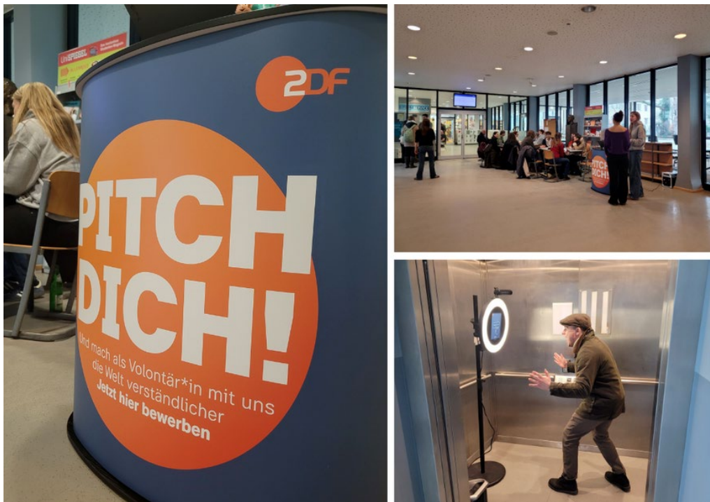
Eindrücke vom Elevator Pitch am Institut für Publizistik- und Kommunikationswissenschaft | Bild: Privat

Am 23. Januar war das ZDF mit der Aktion „PITCH DICH!“ bei uns an der Universität zu Gast. Interessierten bot sich dabei die Möglichkeit, sich direkt vor Ort für den kommenden Volontariats beim ZDF zu bewerben. Dabei konnten die Studierenden in Form eines Elevator Pitches ihr journalistisches Talent unter Beweis stellen. Der maximal zwei-minütige Elevator Pitch beinhaltete eine kurze persönliche Vorstellung sowie einen inhaltlichen Teil zu einem selbstgewählten Thema aus dem eigenen Fachgebiet. Die Aktion fand unter reger Teilnahme der Studierenden passenderweise in einem Fahrstuhl am Fachbereich Politik- und Sozialwissenschaften statt.