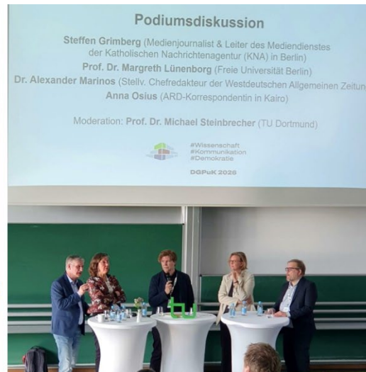
Mitarbeiter:innen des Instituts für Publizistik- und Kommunikationswissenschaft an der Jahrestagung der DGPuK in Dortmund | Cover des Sonderheftes