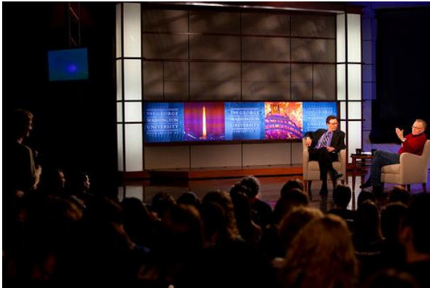
Diskussionsrunde mit Larry King

Der Umfang des wissenschaftlichen Kollegiums erscheint hoch: 25 Professoren und Juniorprofessoren („assistant professors“) sind momentan Vollzeit am Institut angestellt, 26 Dozenten arbeiten Teilzeit. Dazu kommen Gastdozenten aus der Medien- und Kommunikationswissenschaft, der PR und dem Journalismus. Wie im Amerikanischen üblich sind Studenten und Dozenten per „Du“. Die Hierarchie zwischen den Gruppen erscheint flacher als in Deutschland. Dozenten bieten nicht nur akademische Hilfe an, sondern betonen auch, dass sie bei allgemeinen oder privaten Problemen mit offenem Ohr zur Seite stehen.