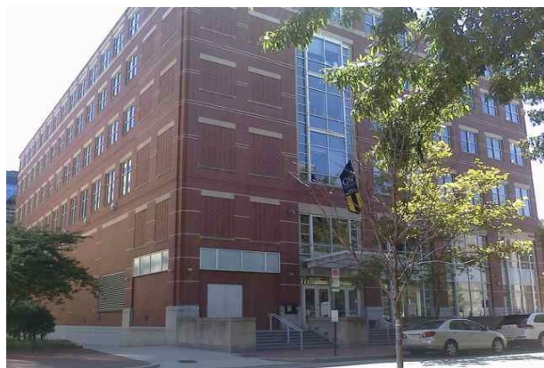
Die School of Media and Public Affairs

Das Studium an der George Washington University brachte viel Gewohntes und auch viel Ungewohntes mit sich. Als Erstes und wohl Wichtigstes ist bei der Planung eines Auslandsaufenthaltes zu beachten, dass amerikanische Universitäten anderen Semesterzeiten folgen. Während an der FU Vorlesungen von April bis Juli stattfinden, haben amerikanische Studenten in dieser Zeit Semesterferien. Stattdessen findet ein Semester im Frühjahr (Vorlesungszeit: Januar bis Mai) und ein Semester im Herbst (Vorlesungszeit: August bis Dezember) statt (s. exemplarisch den Akademischen Kalender 2011/2012 ).