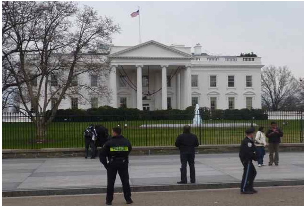
Das „Weiße Haus“

Für einen Master-Studenten der Medien und Politischen Kommunikation gibt es wohl kaum einen besseren Ort zum Studieren als Washington DC. Die George Washington University (GWU), die ich von Ende August bis Ende Dezember 2011 besuchen durfte, liegt im Herzen amerikanischer und internationaler politischer Arbeit. Keine zehn Minuten zu Fuß braucht es, um einen Blick auf die Regierungszentralen einer Großmacht zu werfen: Das Weiße Haus, das Capitol und der