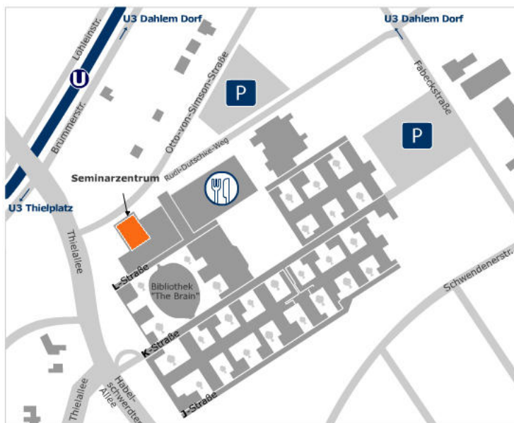
Abbildung 2 Seminarzentrum, Otto-von-Simson-Str. 26, Raum L 115