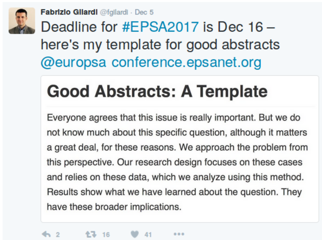
Abbildung 1: Beispielschema für den Aufbau eines Abstracts

Der Abstract fasst Ihre Arbeit in maximal 150 Wörtern zusammen. Folgendes Schema kann als Orientierung dienen. :-)