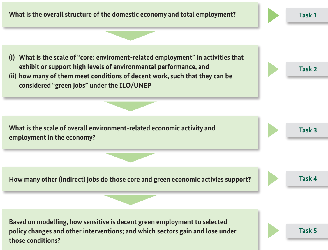
Abbildung 2: ILO-Leitfaden „Approaching the five tasks“